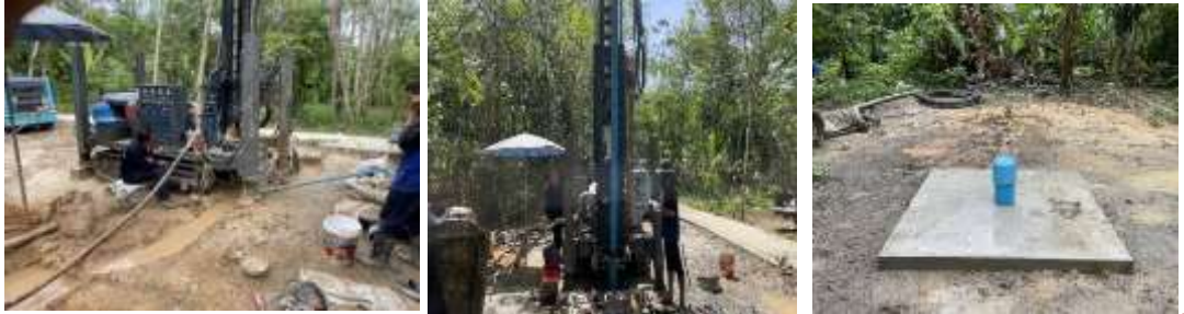
โครงการขุดเจาะบ่อบาดาลบ้านเกาะมุกด์ หมู่ที่ ๒ (บ่อที่ ๑)